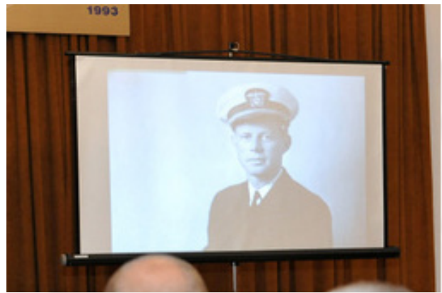
Predstaviteľ a zakladajúci člen združenia, ako aj Medzinárodného mierového výboru otvára Rok Johna Fitzgeralda Kennedyho.

Osobnosti svetovej politiky sú cielavedome vytlačené z pamäti občanov tohto sveta. Novými osobami, ktoré nadobudnú pocit, názor, ba až skalopevné presvedčenie, že sú viac ako ich predchodcovia. Mnohí si dokonca privlastňujú ich činy – počiny a pomáhajú tomu, aby pôsobili neaktuálne ako bytosti až historické postavy z dejín. Prípad J. F. K. je z druhej polovice minulého storočia a od jeho vraždy uplynie v novembri budúceho roka 55 rokov. Ako generácia sme mali to šťastie, že sa stal vďaka našim prarodičom a rodičom nielen legendou, ale príkladom sympatickeho, rozumného a mierotvorného politika v období najstudenejšej vojny. Nemusel meditovať o indexe šťastia ako niekdajší francúzsky prezident, ale, žiaľ, iba