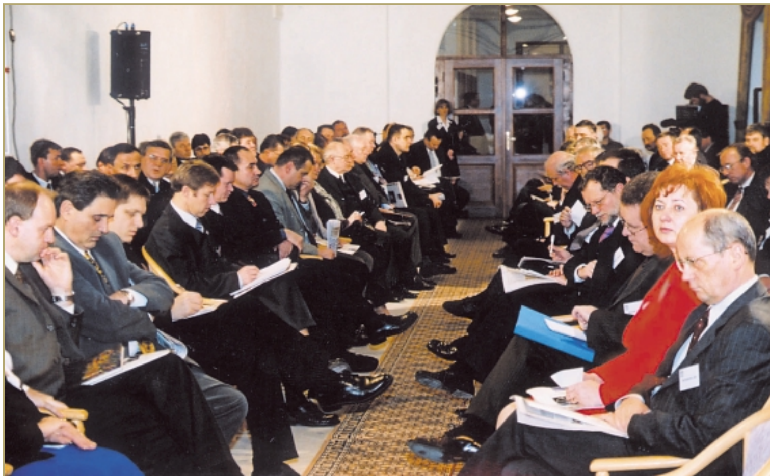
Views on the main hall of Pálffy Curia in Zámocká Street in Bratislava, venue of the 5th general assembly held on 14 February 2002, with participation of all political leaders, except from SDKÚ. 8th general assembly will be held in the same hall on 26 January 2006. Main discussion topic: New Thinking in the New Europe - in the New World. Pohľady do hlavnej sály Pálffyho kúrie na Zámockej ul. v Bratislave, kde sa uskutočnilo V. valné zhromaždenie 14. februára 2002 za účasti lídrov politických strán s výnimkou SDKÚ. V tejto sále bude aj VIII. valné zhromaždenie 26. januára 2006 s hlavnou diskusnou témou Nové myslenie v Novej Európe - v Novom svete.