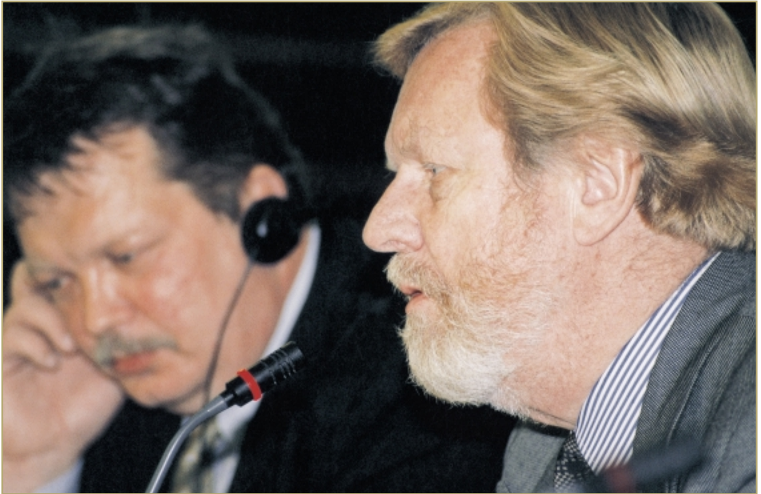
16 March 1998, Forum Hotel, Bratislava - US Politologist J. Naisbitt, co-author of the book "Megatrends 2000", as a guest of the club. 16. marec 1998, hotel Forum - Hosťom klubu bol aj politológ J. Naisbitt zo Spojených štátov, spoluautor knihy Megatrendy 2000.