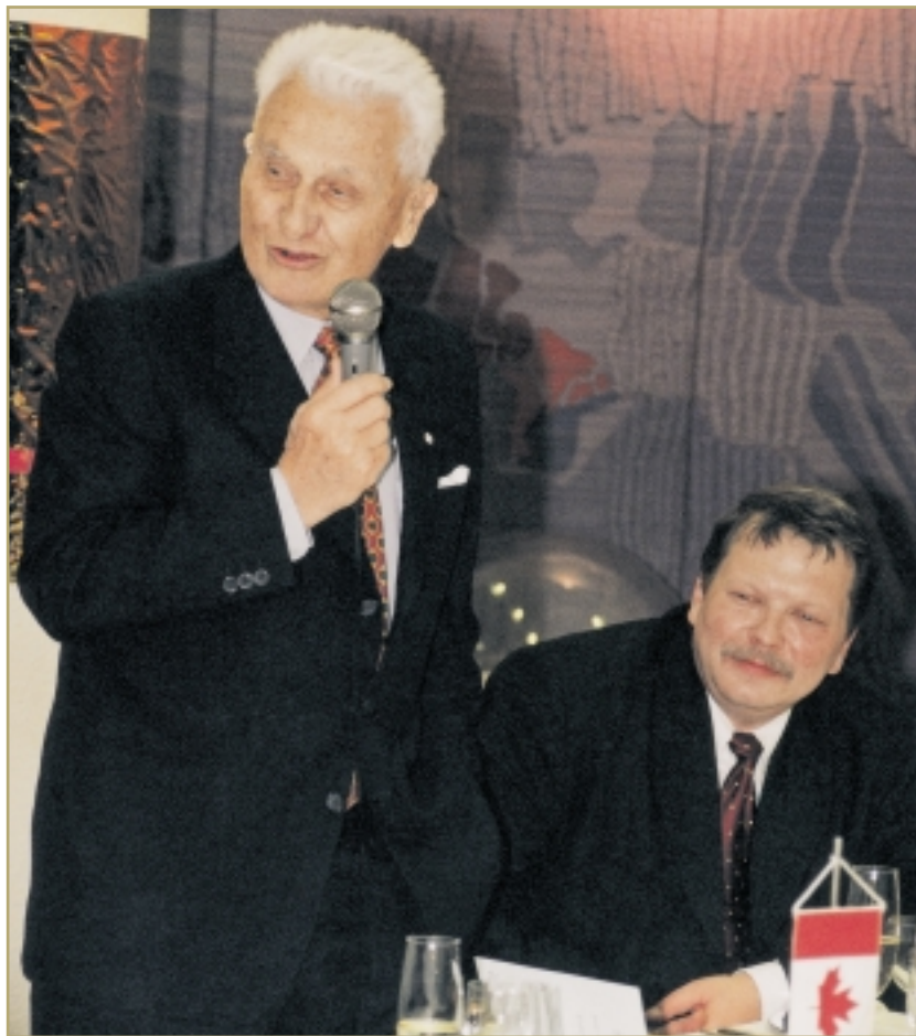
3 August 1998, Forum Hotel, Bratislava Canadian businessman and legend with Czech roots, Tomáš Bata, is addressing members of the club. 3. august 1998, hotel Forum K členom klubu sa prihovára kanadská podnikateľská legenda českého pôvodu T. Bata.