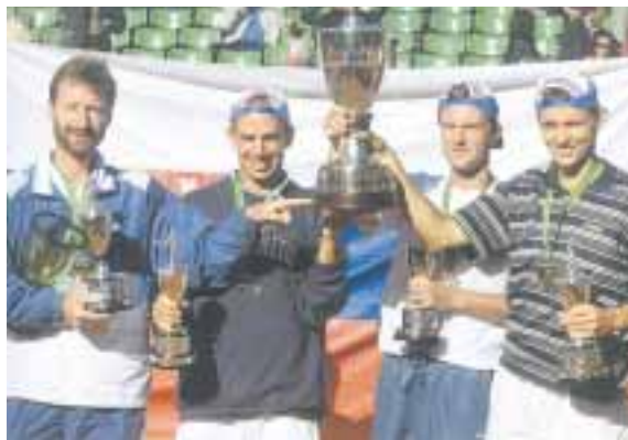
Po úspechoch v športe by mali prísť úspechy v podnikaní.

som na poste technického vedúceho pri národnom tíme do 16 rokov. V akej oblasti však budem podnikáť, zatiaľ vôbec neviem,“ tvrdí odchovanec nitrianskeho futbalu. Kométou v podnikateľskej sfére bývalých športovcov