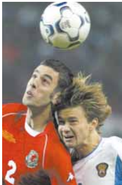
S touto loptou sa hrala kvalifikácia.

Na európskom futbalovom šampionáte v Portugalsku sa bude hrať výlučne s novou sériou lopt s názvom Roteiro z dielne firmy Adidas . Loptu otestovali aj špičkoví hráči ako Beckham či Zidane . „Roteiro skvele prilieha na moju nohu a je dobre ovládateľná. Tiež má veľmi dobrý let pri priamych