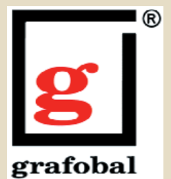
Grafobal, a. s., Skalica